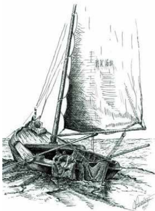
Aan het vissen met de kuil op ansjovis. Dezelfde kuil waarmee ook haring werd gevangen.