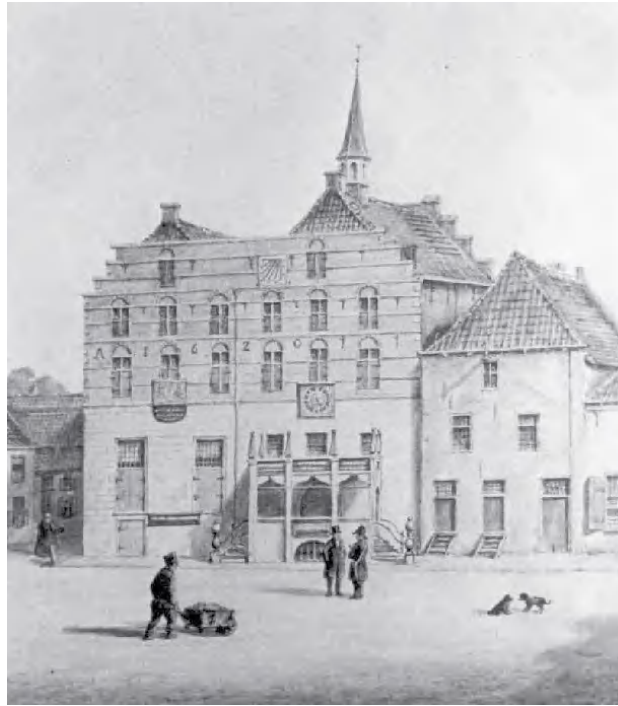
'Het Stadhuis te Harderwijk in 1834', tekening in potlood en aquarelverf, door de griffier-amateurschilder Christiaan Willem Moorrees, vóór de grote verbouwing van 1837 (in bezit van het Stadsmuseum).