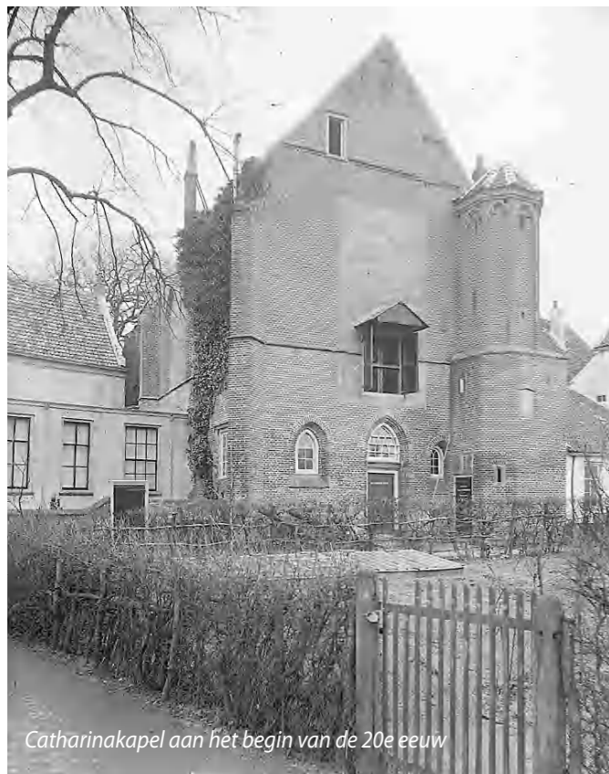
Catharinakapel aan het begin van de 20e eeuw