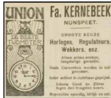
Filiaal in Nunspeet