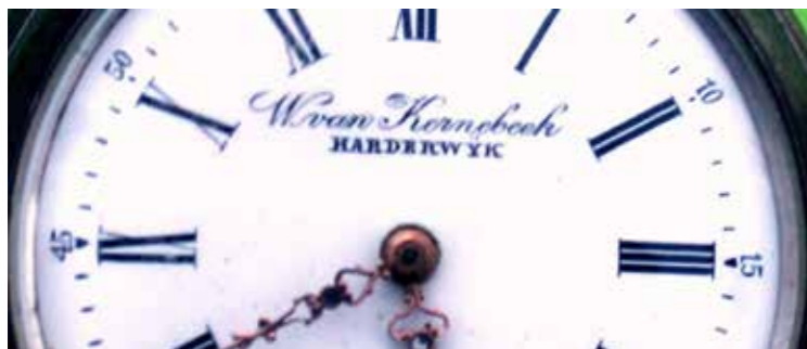
Detail van de wijzerplaat

Het filiaal in Nunspeet was gevestigd ten huize van de gebroeders Mulder, wagenmakerij. De zaak is niet alleen een horlogezaak en een juwelierswinkel, maar