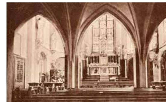
Interieur van de Catharinakapel in 1915

De Catharinakapel heeft tot 1962 dienst gedaan als parochiekerk van de Parochie van de H. Catharina in Harderwijk. In juni 1962 heeft de parochie de huidige Catharinakerk aan de Van Maerlantlaan in gebruik genomen. De Catharinakapel werd weer aan de gemeente Harderwijk verkocht. Thans is de kapel in gebruik als kunstcentrum (in de benedenkerk) en als klein theater (in de bovenkerk).