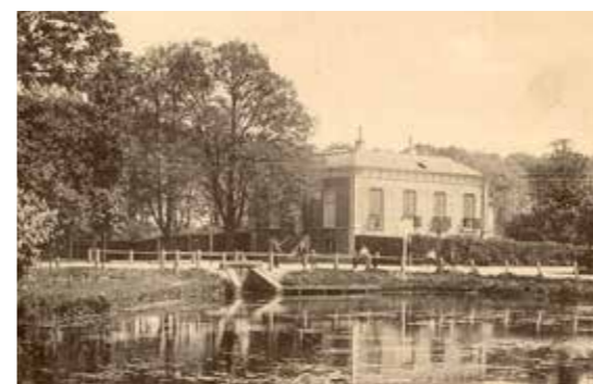
Villa Flevo Rama aan de Diepegracht. Op deze plaats bevindt zich nu de Plantagekerk.

eind van zijn leven heeft gegeven, de bouwkundige situatie van kerk en pastorie verre van rooskleurig. Ook het kerkbestuur noteerde in de notulen van haar vergadering uit die tijd: 'Jaar op jaar gaan alle batige saldo's verloren aan reparaties van de oude kerk en pastorie; op den duur kan de toestand zóó niet blijven'. Vooral de dakconstructie van de kerk was een bron van zorg. Het kerkbestuur had ook al een plek in gedachten voor een mogelijk nieuw te bouwen kerk met pastorie: Flevo Rama. Flevo Rama was destijds in eigendom bij de parochie en bestond uit een villa met een grote tuin. Maar omdat de kosten voor nieuwbouw op dat perceel te hoog zouden worden voor de kleine parochiegemeenschap was dit in feite geen optie.