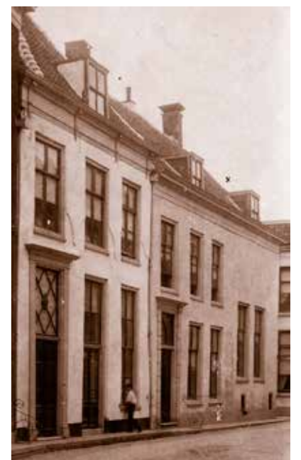
Pastorie aan de Donkerstraat 34