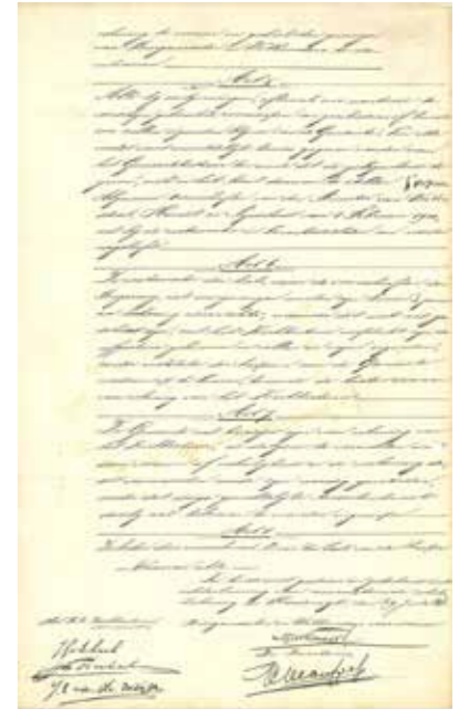
Blad 2 van de verkoopakte van de Catharinakapel van 29 juli 1911