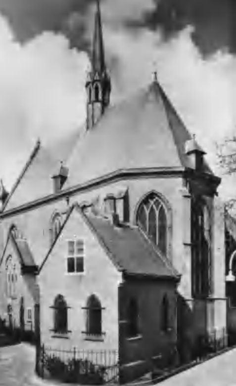
Catharinakapel na de verbouwing in 1913 met sacristie en torentje op de uitbouw