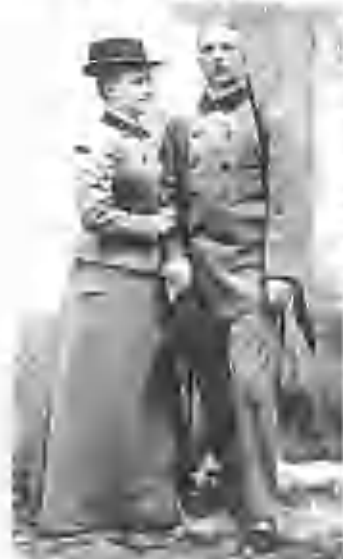
Wilhelmina en Hendrik in jachttoeluum.