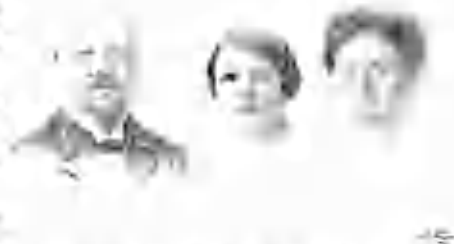
Hendrik, Juliana, Wilhelmina "De goede mens die mijn vader was"

Het imago van de prins-gemaal werd sterk verbeterd na de stranding van s.s. "Berlin". Dit schip verging voor de kust. De prins was begaan met de het lot van de opvarenden. Hij liet zich direct inschepen om de redding van nabij te volgen. De pers overdrijft de bemoeienis van de prins enigzins, door te melden dat de prins hoogstpersoonlijk aan de redding van de drinkelingen zou hebben deelgenomen. In werkelijkheid steunde hij bij de uitdeling van voedsel en kleding aan de geredden.