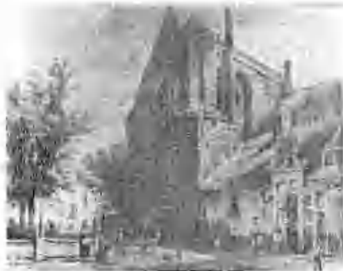
St. Catharinakapel Uit "Harderwijk in oude prenten"