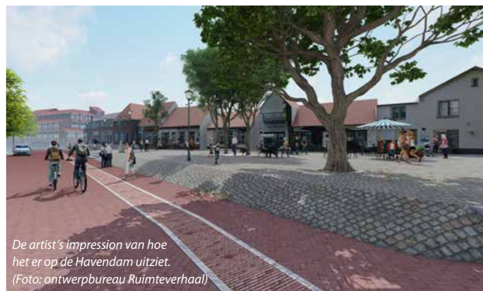
De artist's impression van hoe het er op de Havendam uitziet. (Foto: ontwerp bureau Ruimteverhaal)

Het mooie van dit ontwerp is dat bezoekers overdag op 'de stadsmuur' kunnen wandelen. 's Avonds worden de contouren verlicht. De kleur van die verlichting wordt op afstand geregeld. Belangrijkste doel: de uitstraling van Harderwijk als Vestingstad versterken. Het was de fractie van D66 die in 2019 met het idee kwam om de stadsmuur weer zichtbaar te maken, op plekken waar deze ooit is afgebroken. Een meerderheid van de gemeenteraad vond het een uitstekend idee en er werd budget vrijgemaakt voor de ideeën van Terhorst. De markering in het wegdek is overigens nog niet alles. Ter hoogte van de Kiekmure is namelijk een nieuw stukje 'stadsmuur' gerealiseerd. De onderste lagen zijn