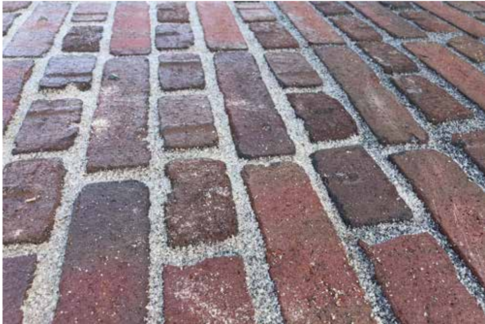
Het straatprofiel van kloostermoppen met grijze voeg. Deze structuur symboliseert de stadsmuur.