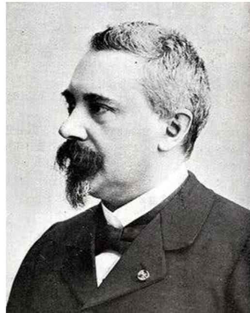
Theo de Meester, een geboren Harderwijker, schopte het tot minister-president.

Er kwam toen een landelijk weinig bekende liberaal naar voren, Theo de Meester (1851 -1919). Deze werd minister-president van een kabinet dat uiterst zwak bleek te staan. Het kon niet bogen op een meerderheid in de beide Kamers. Het moest daarom zeer voorzichtig manoeuvreren. De pers sprak tot vervelens toe over "een kabinet van kraakporselein". Het kabinet-De Meester heeft geregeerd van 1905 tot 1908.