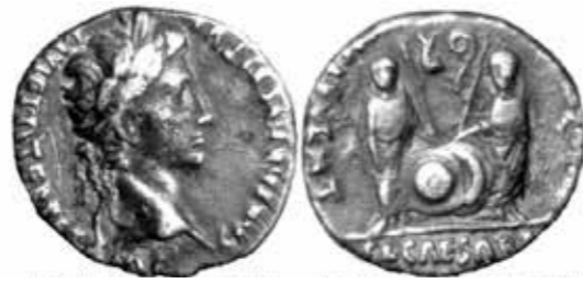
Zilveren denarius anno 16 na Chr., gevonden in het Wolderwijd, in: Vittepraetje juni 2008, nr. 2

met de beeltenis van keizer Augustus. Han mag de munt mee naar huis nemen en zoekt uit hoe deze munt in het Wolderwijd terecht gekomen kan zijn. Hij komt tot een aannemelijke hypothese. De munt is vermoedelijk verloren tijdens een van de Romeinse veldtochten rond het jaar 16 na Chr. Daar waren ook schepen bij betrokken die via de rivieren het Flevomeer bereikten. 5