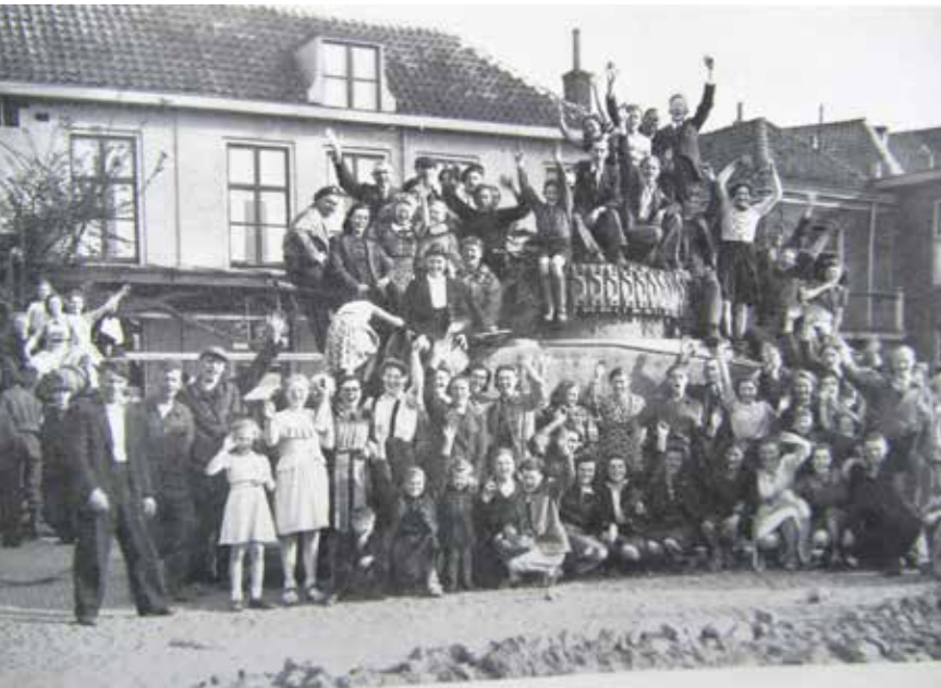
Bevrijding van Harderwijk, feestvierende mensen op een Canadese tank voor Hotel Zeezicht op de Boulevard.

"Huilende, lachende, springende, dol en dwaas doende mensen bestormen de tanks met bloemen en schreeuwen zich schor. Ik zie het en kan het allemaal niet verwerken. Eindelijk, eindelijk de bevrijding! Mijn benen willen opeens niet zo precies meer. God, de bevrijding, de be-vrij-ding!" 7