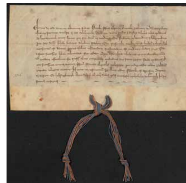
De oorkonde over de vitte uit 1316