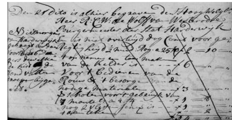
Detail grafregister Harderwijk 1777

Reindert Christoffel Willem de Wolff van Westerroode wordt op 10 juli 1777 te Harderwijk begraven en op 21 juli 1777 in Wilp herbegraven.