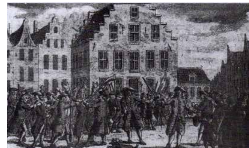
Afbeelding van de Beroerten te Harderwijk in 't jaar 1704 (Veluws Museum te Harderwijk) in: Herderewich Kroniek, 1981, nr. 1 en 2.

Han houdt een aantal lezingen over diverse onderwerpen. Zo is op 29 januari 1974 het onderwerp ‘De cholera-epidemie van 1866 in Harderwijk’. In de volgende jaren schrijft hij over Ernst Brink, een geleerde burgemees-