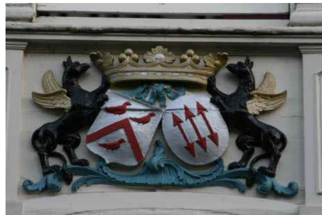
Het alliantiewapen van De Wolff van Westerroode- Wolfsen boven de deur van Donkerstraat 44