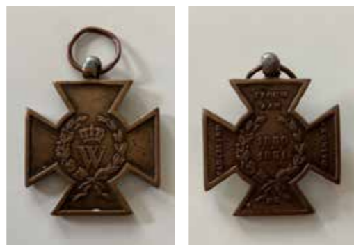
Onderscheiding ter ere van deelname Tiendaagse Veldtocht in 1831, voor- en achterkant.