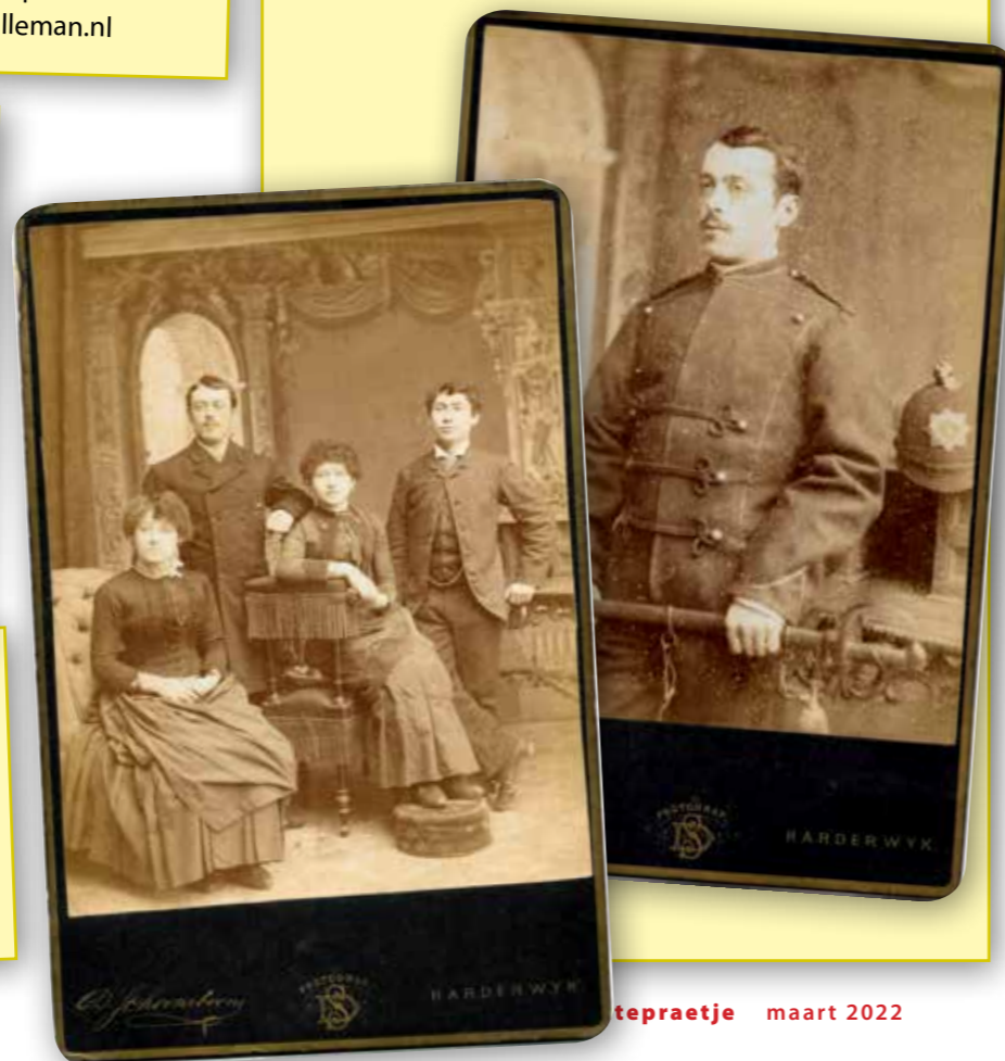
Vittepraetje maart 2022

Reacties kunt u sturen naar: redactie@herderewich.nl