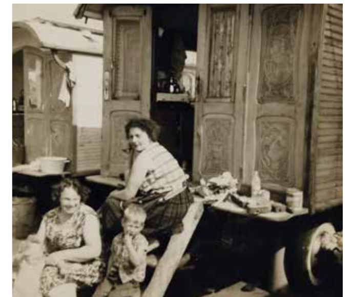
Zie die prachtig bewerkte deuren. Veel woonwagens zijn pareltjes om te zien. De vrouwen houden de wagens brandschoon.

Kampers hebben een eigen taal. Het is geen taal met een uitgespeld alfabet, het is Bargoens. Binnen dit Bargoens worden verschillende dialecten gesproken. Maar over het algemeen begrijpen de reizigers elkaar onderling uitstekend, ook al woont de een in Limburg en de