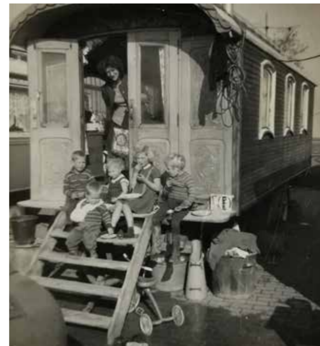
Reizigers zijn het liefst buiten en bij elkaar. Ze zitten vaak op 'de plank'. Hier een stel reizigerskinderen, begin jaren zestig.

“De relatie met de gemeente was minimaal. Kosten om daar te staan bedroegen toen 75 cent per week. Mensen verdienden hun centen met venten, scharen slijpen, stoelen matten, autosloop en verder verhuurden ze zich op grote schaal aan boeren, agrariërs om aardappels te rooien, vlas te trekken, erwten te dorsen. Kinderen werkten hier ook aan mee en in de winter verhuurde men zich aan de hoogovens, aan de suikerbietenfabriek, aan de kolenmijnen in Limburg. Ook werkten reizigers veel in kersen-, appel- en perenboomgaarden. In principe deden ze alles wat nodig was in Nederland. Venten met galanterie was ook typisch iets voor reizigers. Galanterie: dat zijn naalden, garen, elastiek, mesjes, scharen, knijpers, scheerzeep, scheermesjes. Alles wat een mens nodig had voor zijn dagelijkse onderhoud. Vooral op het platteland voorzagen de reizigers in een behoefte.”