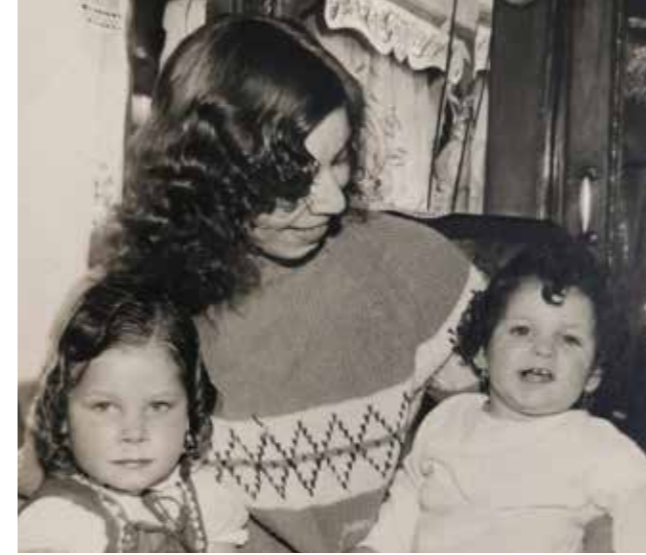
Een reizigersvrouw met twee kinderen. De kinderen zijn nichtjes van elkaar.

Familie is dus het kernbegrip. En een woonwagenfamilie wil het liefst bij elkaar wonen. Het liefst in stamverband, dus met veel wagens. Zo kunnen ze voor