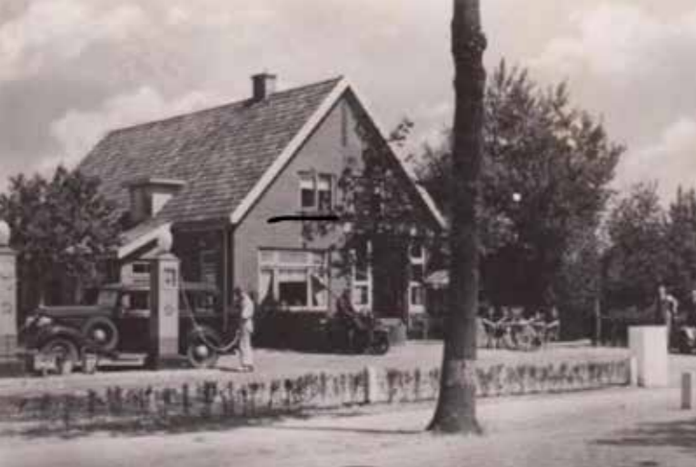
Café Halfweg in periode kort na W.O. II.

makkelijk op konden rijden. De Zuiderzeestraatweg was in die tijd druk en de vrachtwagenchauffeurs bezochten het café graag. Ze kwamen uit Friesland, reisden via Zwolle naar Apeldoorn, maar ze reden om voor de koffie en voor de soep gemaakt door de moeder van Ton, Fietje. Dat bleven ze doen toen de A28 aangelegd was. Ton: “Mijn moeder maakte in de winter 25 liter erwtensoep per keer, in van die grote pannen. Onze prijzen lagen altijd net iets lager dan bij anderen. Was elders de koffie bijvoorbeeld f 1,50, dan was die bij ons f 1,10. Er kwamen ook veel mensen uit de buurt, bijvoorbeeld ondernemers die even snel een bakje koffie kwamen doen of stiekem een biertje kwamen drinken en de dierenarts die elke dag aan tafel 3 zat. Verder was er een telefoon. Dat trok vrij veel mensen van Turkse afkomst die in de groeiende wijk Frankrijk woonden. Die belden dan met het thuisland.”