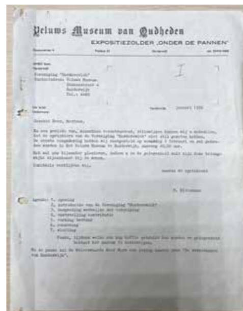
Boven: Uitnodiging oprichtingsvergadering.