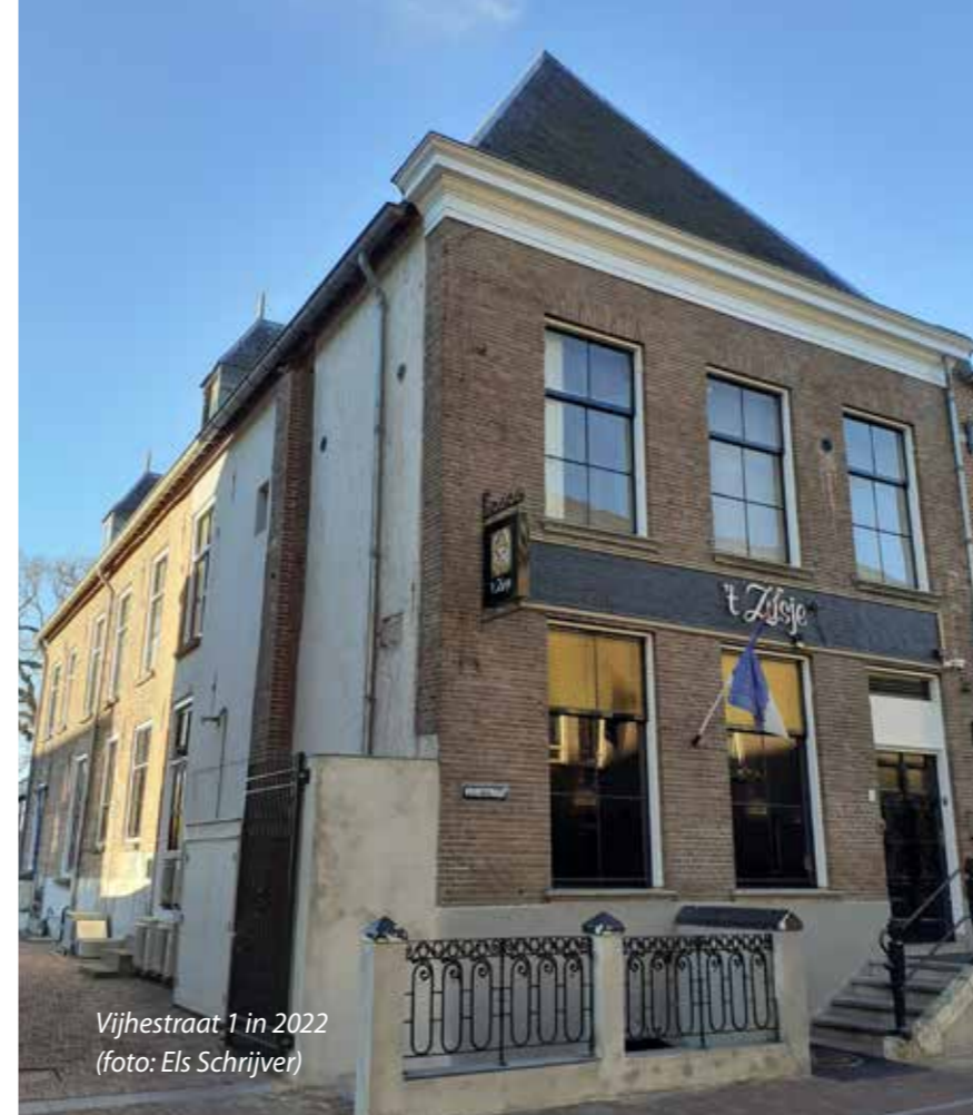
Vijhestraat 1 in 2022