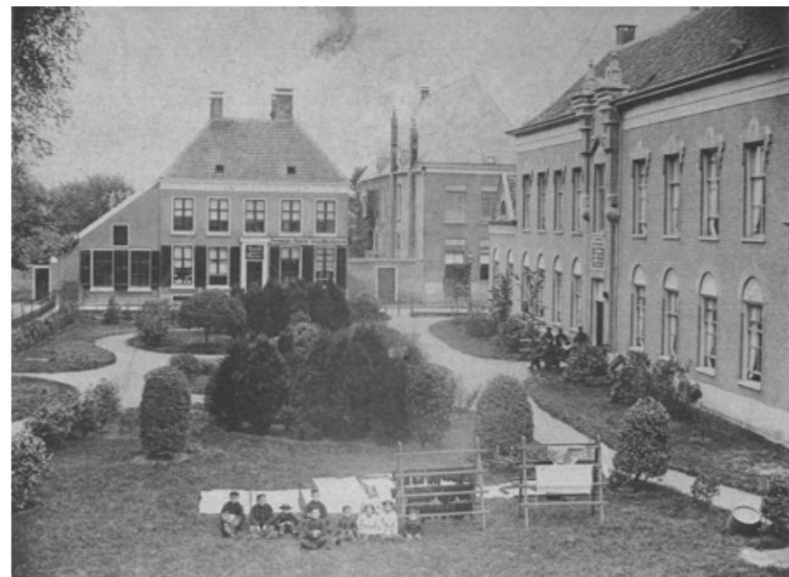
Vijhestraat 1 (in het midden op de achtergrond met 2 schoorstenen aan de zijmuur) omstreeks 1900. Op de voorgrond de tuin van het Oude Mannenhuis

De eerste eigenaars en bewoners van Vijhestraat 1 waren, zoals al eerder gezegd de fraters. Zij boden huisvesting aan de klerken 3 (studenten)