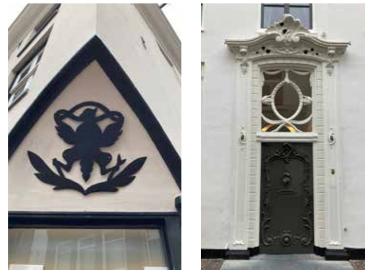
Links: Het symbool van de adelaar was het logo van de tabaksfabriek 'Wapen van Amerika'(rond 1877) Bruggestraat 44-46. Rechts: Gebeeldhouwde deur pand Donkerstraat 29.