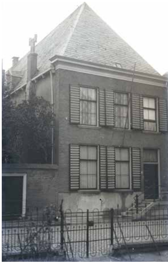
Vijhestraat 1 aan het eind van de 19 e eeuw