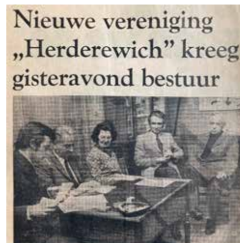
Veluws Dagblad 3 februari 1972: nieuwe vereniging “Herderewich” kreeg gisteravond bestuur. Op de foto het nieuwe bestuur.