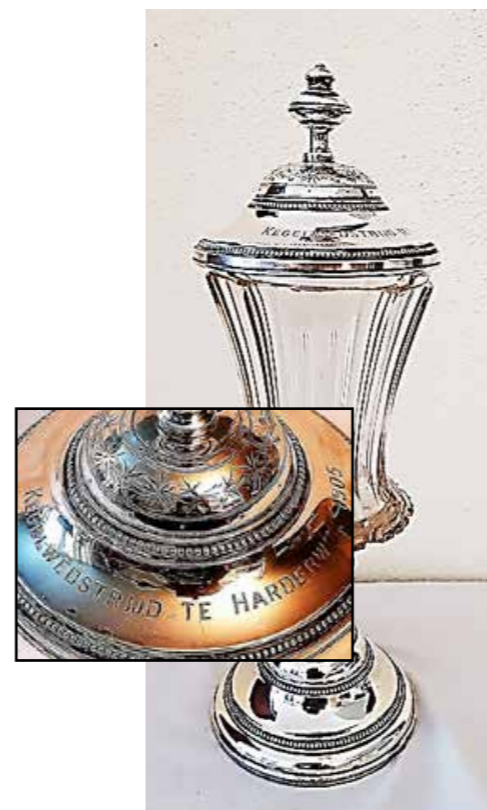
Eerste prijs 1905