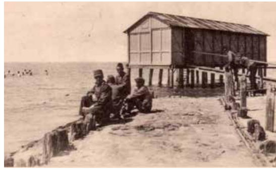
De Noord-Zuidligging tussen 1911 en 1918 aan de Zeebrug. Het contract met het Koloniaal Werfdepot voor het zogenoemde 'dienstzwemmen', zoals hier te zien, was een vaste bron van inkomen voor het Zuiderzeepad.