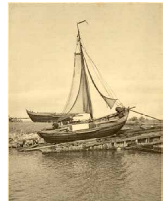
Op de achtergrond een halve botter, opgeblazen door de Duitsers.

het mocht niet baten. De Duitse Wasserschutzpolizei stelt een ultimatum: "Boote sofort zurück in den Hafen, sonst werden Sie gesprengt". De schippers zijn begrijpelijkerwijs nergens te vinden. Met een motorvlet weten de Duitsers bij de schepen te komen en ze op te blazen. Sommige kunnen na de oorlog nog hersteld worden, andere zijn totaal vernield. Op 17 april 1945 vindt nog een luchtaanval plaats op de haven, waar veel Duitse schepen liggen. Diverse boten worden in de grond geboord en enkele Duitsers sneuvelen. Een geallieerd vliegtuig wordt geraakt en stort neer achter de Asbesto-fabriek aan de haven. De piloot komt om. Op 18 april 1945 veroveren de Canadezen Harderwijk. De Duitsers ontvluchten de haven nadat zij nog enkele schepen tot zinken hebben gebracht om zo hun aftocht te dekken. Harderwijk is bevrijd maar de gevolgen en de schade van de bezetting zullen nog lang gevoeld en zichtbaar blijven.