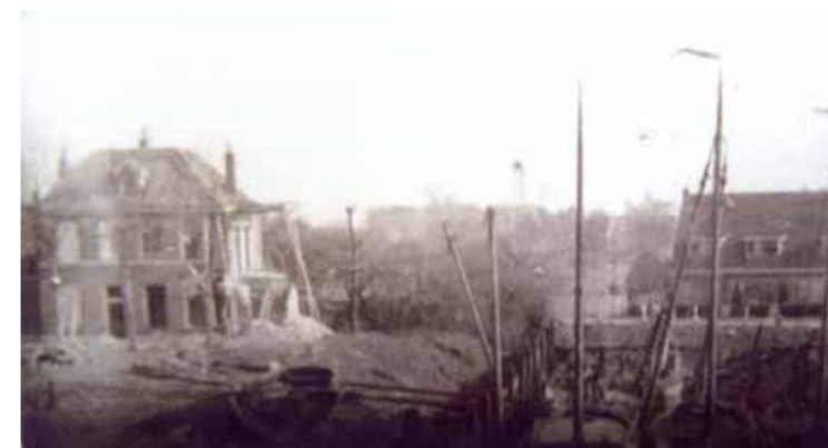
Huis van werfbaas Oost na bombardement

Stellung Hase (de Duitse radar- en af luisterpost) en de haven van Harderwijk werden regelmatig bestookt. De zwaarste aanval vond plaats op 11 oktober 1944. Om 14:10 uur zetten 4 Geallieerde vliegtuigen de aanval op de haven van Harderwijk in. Doelwit is het m.s. 'Kasteel Staverden'. De gevolgen zijn desastreus. Het vrachtscheepje 'Aaltje Johanna' van groentehandelaar W. Foppen wordt getroffen en er zijn 5 dodelijke slachtoffers te betreuren: de broers Taeke en Klaas Scheepstra, Willem Brands, Heimen Foppen en Goossen Foppen, een zoon van de eigenaar van het schip.