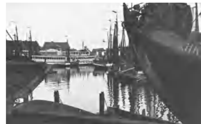
Achterin de vissershaven ligt de 'Kasteel Staverden', regelmatig doelwit van geallieerde vliegers

In de loop van de oorlog gingen de Geallieerden het luchtruim beheersen. Britse en Amerikaanse vliegtuigen bombardeerden massaal doelen in Duitsland en de bezette gebieden. Ook op Harderwijk vonden meermalen aanvallen van geallieerde vliegtuigen plaats. Het station en de spoorlijn,