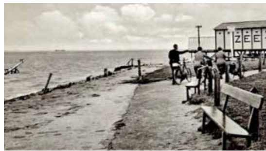
De West-Oostligging van 1919 tot 1940. Er werd alles aan gedaan om het bad aantrekkelijk te maken zoals hier met een 'zee-wip'. Deze positie gaf stormen uit meest westelijke richting minder vat op het badgebouw. Hoewel...

bouw neergezet. De schade, veroorzaakt door stormen uit westelijke richtingen, moet iemand tot het inzicht hebben gebracht dat de ligging met de lange zijde evenwijdig aan de kustlijn daar debet aan is. Het nieuwe gebouw wordt dan ook 90° gedraaid.