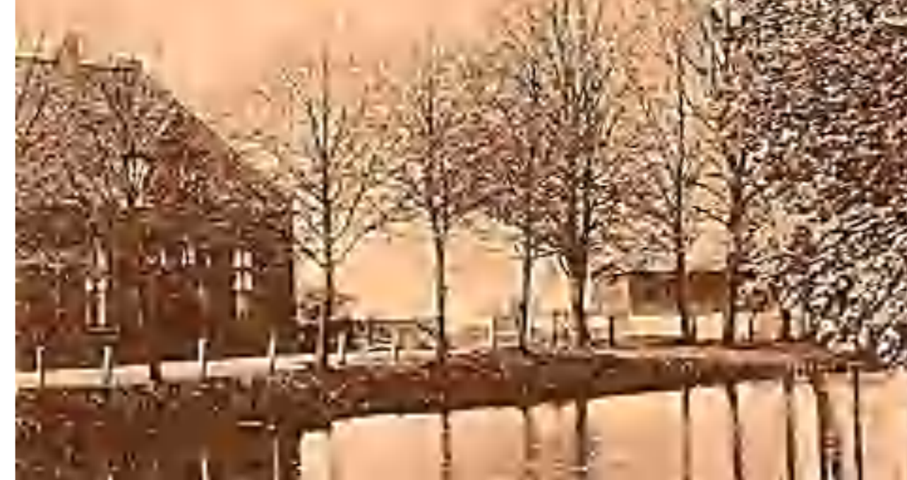
Diepe Gracht, midden achter de Kegelbaan

In de maand december 1905 organiseerde het bestuur van de kegelbaan een wedstrijd voor de inwoners van de stad. De prijs voor een kaart van 5 worpen bedroeg 10 cent. De wedstrijd werd