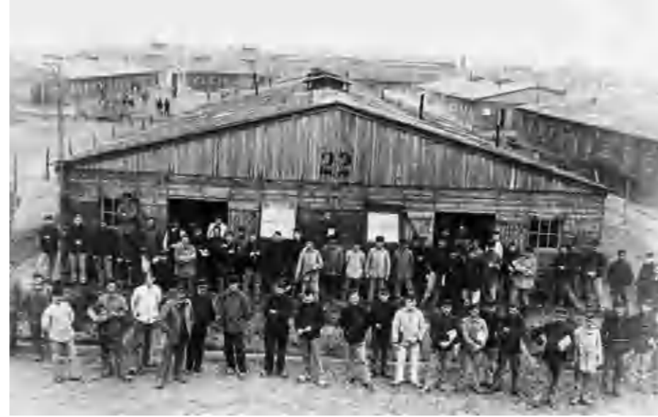
Barak 22 in het Belgenkamp

Na een warm onthaal in het begin bleef onvrede dan ook niet uit. Zowel van de kant van de bevolking van Harderwijk alsmede van de kampbewoners. Er werd na verloop van tijd met minachting naar de Belgen gekeken alsof zij ongemanierde luiaards waren die verslaafd waren aan drank. Toen op 13 januari 1917 de zesjarige Woutje van der Velde om het leven kwam veroorzaakte dit grote ontsteltenis in Harderwijk. Een Belgische korporaal vergreep zich aan het meisje en bracht haar om het leven. De krijgsraad veroordeelde hem tot