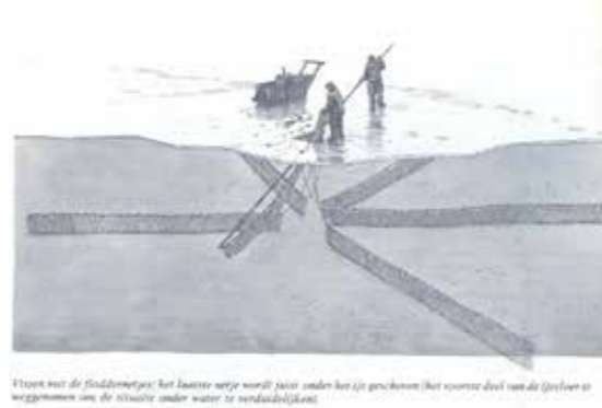
Staan met de stuurman op het laatste water voor de boot om het ijs te spreken (het voorste deel van de boot is weggenomen om de situatie onder water te verduidelijken).

gedachtenis aan vissers die bij hun gevaarlijk werk het leven hebben gelaten. Niet altijd is duidelijk welke criteria zijn gehanteerd om tot inventarisatie van de namen van deze vissers te komen. Een uitzondering vormt het Scheveningse monument waartoe de stichting VissersNamenMonument Scheveningen uitputtend vooronderzoek heeft gedaan en goed heeft omschreven wie op hun monument thuishoort.