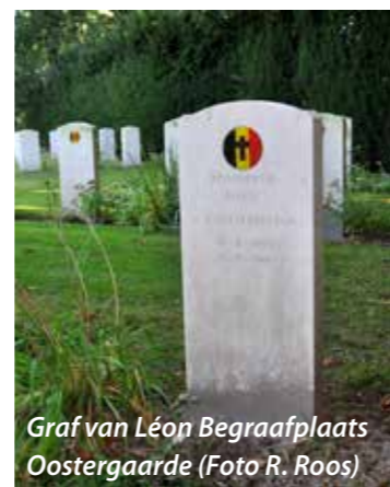
Graf van Léon Begraafplaats Oostergaarde

Historisch Genootschap Oud Soetermeer, Gertjan Moers Oudheidkundige Vereniging Herderewich Stadsmuseum Harderwijk