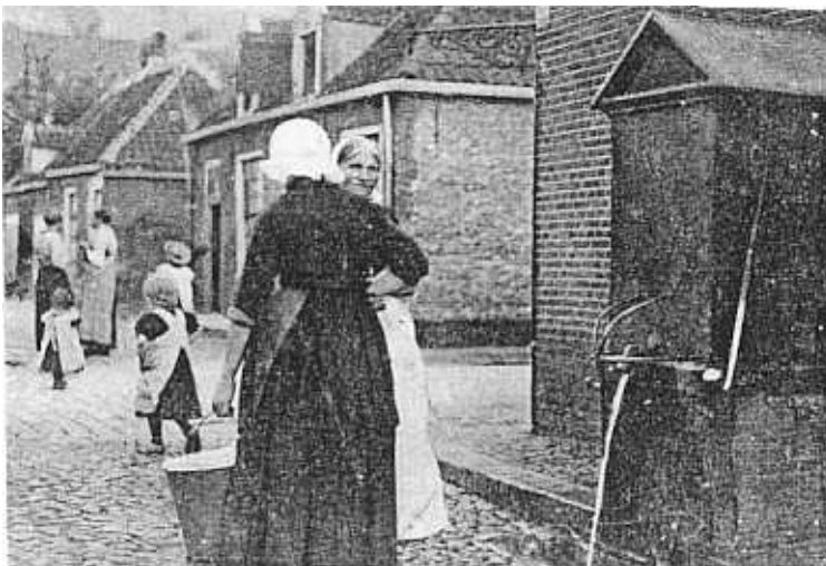
Pomp Kromme Oosterwijk, hoek van de Rechte Oosterwijk

Op 22 februari 1656 werd een pomp geplaatst op de put in de Luttekepoortstraat en op 21 mei 1656 vervingen de putmeesters de put door een pomp in de Bruggestraat en dat ging door tot elke put in straat of op plein voorzien was van een pomp. In 1895 werd in Harderwijk een begin gemaakt met de aanleg van waterleiding. Op de Galgenberg werd een watertoren gebouwd en dit was het begin van het einde van het "putten en pompen tijdperk".