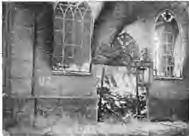
Brand Geref.Kerk 1942.

*) Inmiddels gebeurd. Zie het artikel hierna.