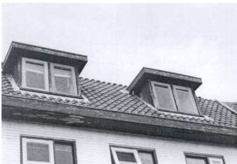
Bepaald niet fraai op de Smeepoortenbrink