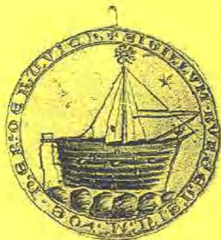
Zegel van de kooplieden van Harderwijk uit 1263. Randschrift: "sigillum burgensium de herderewich"