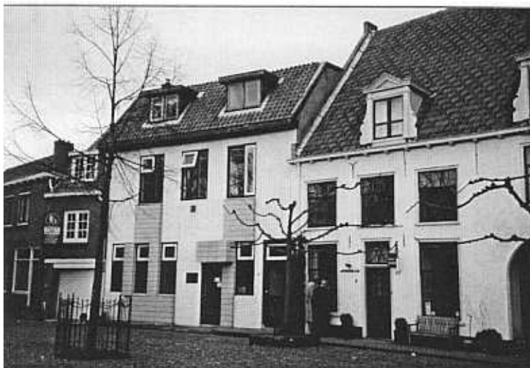
Niet zo fraai en heel mooi op de Smeepoortenbrink

Graag zien we inzendingen van onze leden voor deze rubriek tegemoet.