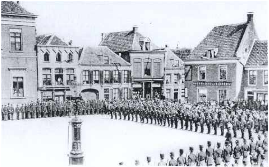
De markt omstreeks 1900 op een Koninginnedag

Een voor West-Indië bestemde koloniaal, heeft op zondagmiddag 10 juni de kazerne verlaten. Er wordt een rijtuig uitgezonden en enkele onderofficieren rijden per fiets uit om de vluchteling op te sporen, maar vergeefs. Een collega ontvangt na enkele dagen een briefkaart uit Dortmund waarin de deserteur meldt dat hij in veiligheid is.