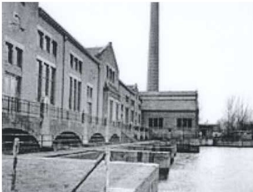
Het Ir. D.F. Wouda-gemaal te Lemmer

Het comité beschouwt het gemaal als een symbool van de Nederlandse strijd tegen het water en een hoogtepunt in de Nederlandse waterbouwkunde. Het Wouda-gemaal is de grootste en krachtigste door stoom aangedreven installatie die ooit voor hydraulische doeleinden is gebouwd. Het stamt uit 1920 en is nog steeds in functie. Bij de recente wateroverlast in oktober heeft het 13 dagen onafgebroken gemaal om het overtollige water af te voeren. De plaatsing op de Wereld-erfgoedlijst betekent wereldwijde erkenning van het culturele en historische belang van dit door de Nederlandse regering voorgedragen industriële monument. De UNESCO noemt het gemaal een bijzonder symbool van menselijke creativiteit; van de internationale betekenis van Nederlandse waterbouwkunde en van het stoomtijdperk.