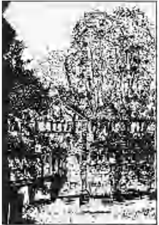
Entree fort bij Rijnauwen.

In de voormalige Nieuwe Hollandse Waterlinie liggen nog steeds de nodige forten. Fort Rijnauwen, oostelijk van - Utrecht, met een oppervlakte van 22 Ha, is het grootste van ons land. In tegenstelling met het doel waarvoor ze gebouwd zijn heerst er op deze overwoekerde locaties eerst een serene stift. Temidden van verkeersdrukte en nieuwbouw vinden we er een oase van rust.