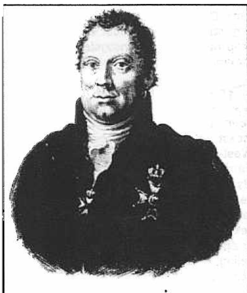
Jan de Winter (1772-1824) afg. Willem Blommestein

In de St. Pieterskerk in Leiden werd in 1836 een gedenksteen voor hem opgericht.