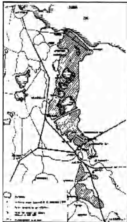
De Nieuwe Hollandse Waterlinie van de Zuiderzee tot aan de Lek

N a zijn inleiding leek het er even op of de heer Van Broekhoven een geheel militair technisch betoog zou geven houden over boeren en graansteek met standaard uitdrukkingen en het militaire ambonec. Bij het vorderen van de lezing werd alomtegenwoordig duidelijk dat M.J.M. overtuigend was zonder de hals recht over de waterlinie of zijn contact te halen. Het verhaal werd stapsgewijs maar met grote stappen afgewandeld, te beginnen bij de opbouw van de Nieuwe Hollandse Waterlinie voor een land. Ter vergelijking: er zijn voorbeelden in de defensiestrategie van zware landen, zoals in Rusland met zijn enorme uitgestrektheid maar in de vijand zich het oedroperen in Vietnam met zijn enorme bossenlanden, in het ontoegankelijke Zwitserland en in Nederland niet met het water.